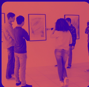
Rencontre avec un artiste suivie d'un atelier pratique