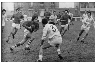
Match de rugby, 1970. Archives dép. de Seine-Saint-Denis, 35 Fi 379.

L'objectif est de réaliser un projet autour de documents en lien avec le sport et son histoire qui auront été préalablement collectés par les élèves. Le partenariat avec un service des archives (par exemple les archives nationales, départementales ou municipales) et/ou une ou un artiste est grandement encouragé, notamment pour la phase de production du projet.