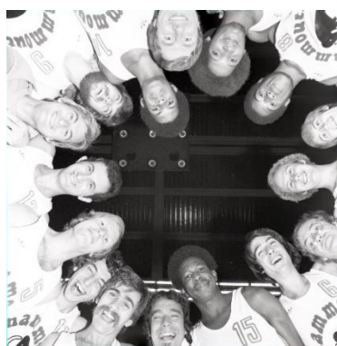
Equipe de l'ASPO de Tours, 1975. Archives dép. d'Indre-et-Loire, 5 Fi 064012.

Inscriptions sur ADAGE du 20 novembre 2023 au 20 mai 2024.