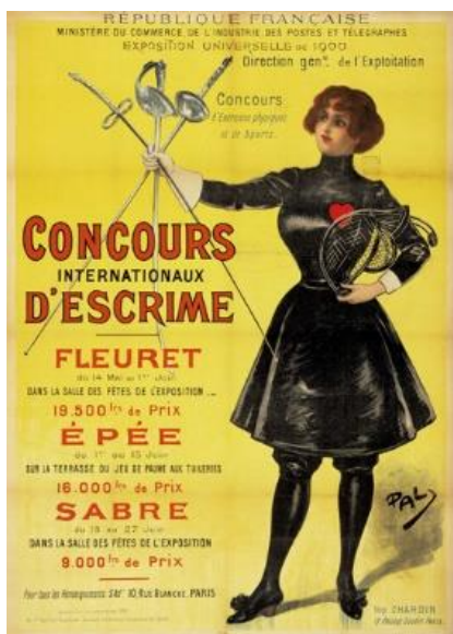
Concours international d'escrime à Paris, 1900. Archives nationales, CP/F/12/4277.

En 2022, une Grande Collecte des archives du sport a été lancée par le ministère de la Culture (service interministériel des Archives de France) dans la perspective des Jeux olympiques et paralympiques de Paris 2024. Cette opération a pour ambition de préserver et de valoriser le patrimoine sportif à travers une collecte de documents d'archives. Inscrite dans le plan « Héritage de l'État » et labellisée « Olympiade culturelle », la Grande Collecte s'intègre dans les dispositifs d'éducation artistique et culturelle (EAC) et d'éducation aux médias et à l'information (EMI) du ministère en charge de l'Éducation nationale.