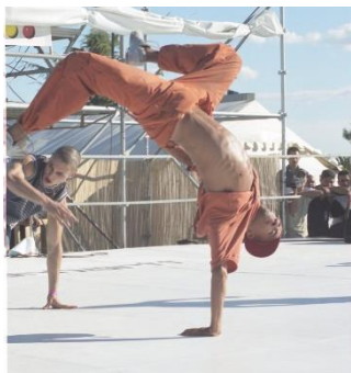
Festival attitude concert de hip hop à Grammont, 2002.