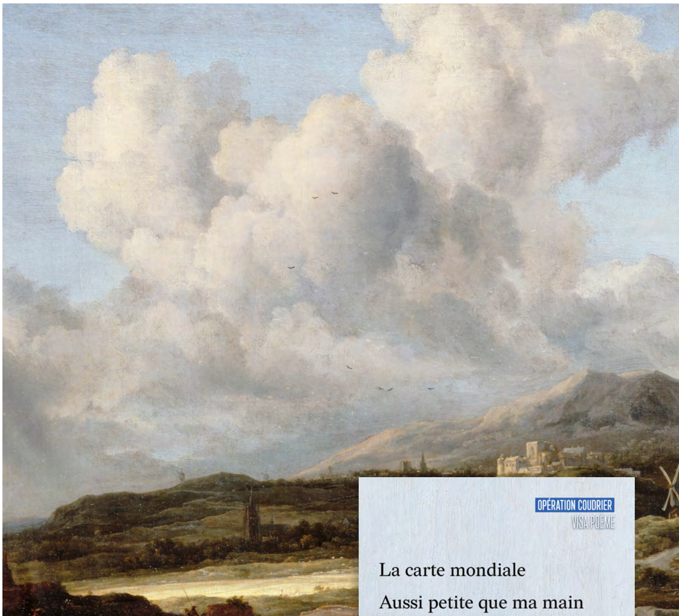
Le coup de soleil, Jacob Van Ruisdael