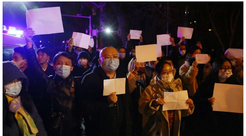
Manifestation Pkin, le 27 novembre 2022, contre la politique "zéro Covid".