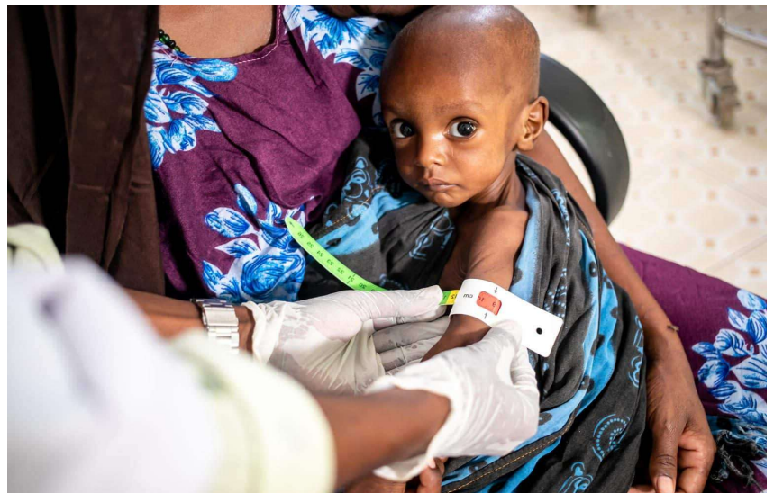
Le 5 février 2022, dans un hôpital de Somalie, un enfant de 12 mois se fait mesurer le bras. Selon l'indication rouge, il souffre de malnutrition importante.