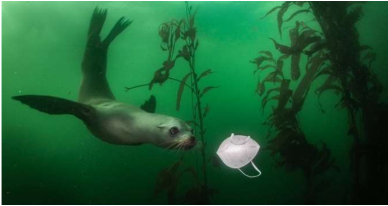
Une otarie de Californie joue avec un masque sanitaire sur le site de plongée Breakwater à Monterey, en Californie, aux Etats-Unis – 19 novembre 2020– Ralph Pace.

Par groupes, choisissez une photographie et faites l'analyse de l'image.