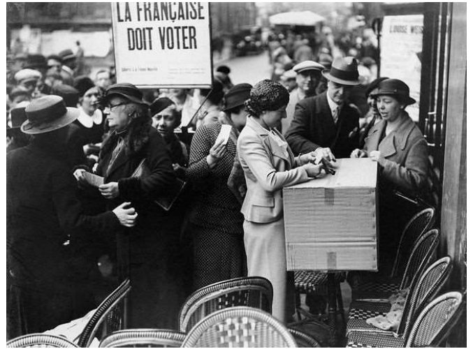
Elections municipale 5 mai 1935, Louise Weiss installe un bureau de vote fictif où les femmes, comme les hommes peuvent voter